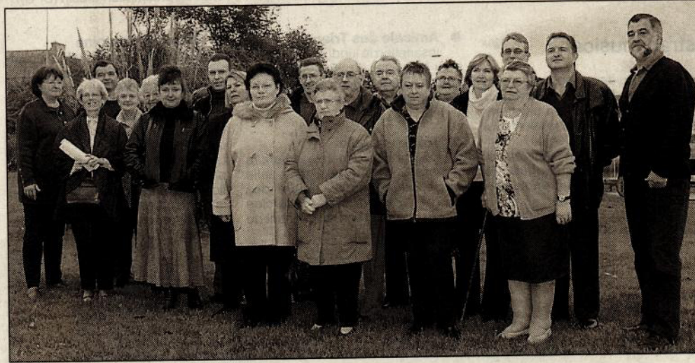
Une trentaine de Le Penven (pas tous sur la photo) se sont retrouvés pour ces premières retrouvailles.

Dimanche matin a été un grand jour pour les Le Penven. Grâce à leur toute nouvelle association, ils ont tenu leur première assemblée générale. L'occasion pour les adhérents de faire les premières retrouvailles entre... inconnus, pour la plupart.