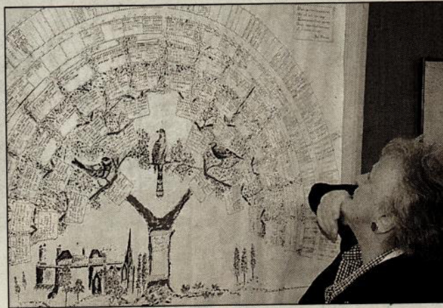
Perplexe devant cet arbre généalogique aussi artistique que complexe !