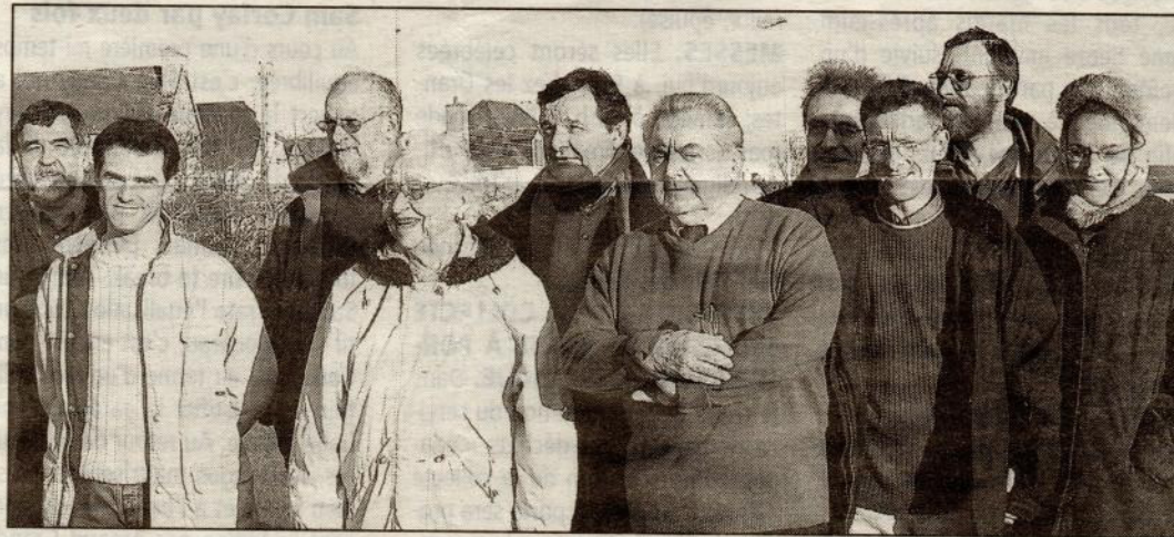
● Le conseil d'administration de l'association Le Penven.

Aujourd'hui, 71 adhérents font partie de l'association. « Treize grands tableaux de cousinage, sur douze adhérents, ont déjà été réalisés », explique le président. Le nombre de personnes qui ont contacté l'association « nous laisse à penser que nous allons multiplier par 1,5 nos adhérents, au